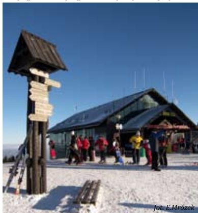
Stacja górna kolejki gondolowej na Jaworzynę

Stacja dysponuje nowoczesną koleją gondolową na szczyt Jaworzyny Krynickiej (1114 m n.p.m.) oraz dziewięcioma wyciągami orczykowymi o przepustowości ok. 14 tys. osób na godzinę i wyciągiem szkoleniowym dla dzieci. Do dyspozycji gości jest 6,5 km tras narciarskich, w tym najdłuższa w Polsce oświetlona trasa oraz 8 km tras sztucznie dośnieżanych o zróżnicowanym poziomie trudności, stale ratrakowanych. Śnieg utrzymuje się tu przez 150 dni w roku. Wytyczone trasy posiadają certyfikat homologacji FIS, a narciarze znajdują się pod stałą opieką GOPR. W stacji czynna jest wypożyczalnia i serwis sprzętu, sklepy ze sprzętem sportowym