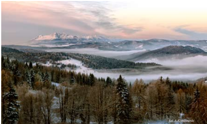
Panorama spod bacówki nad Wierchomla na pasmo Radziejowej i Tatry

Znaki zielone: Białowodzka Góra – Tęgoborze – 3,8 km, czas marszu 1,5 godz.; Tylmanowa Rzeka – Jaworzynka – 5,5 km, czas marszu 1 godz. 45 min.; Jazowsko –