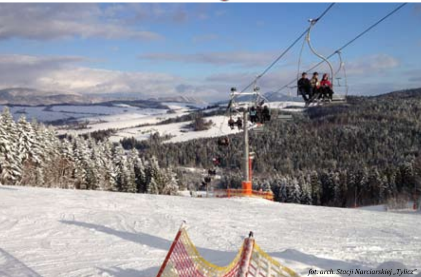
fol. arch. Stacji Narciarskiej „Tylicz”