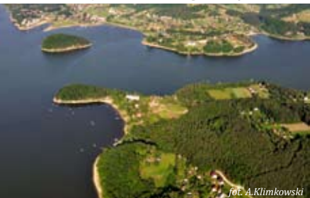
Panorama Jeziora Rożnowskiego z lotu ptaka

Ośrodek Szkolenia Żeglarskiego i Rekreacji Wodnej YC PTTK „Beskid” tel. +48 18 444 91 00 www.znamirówice.pl