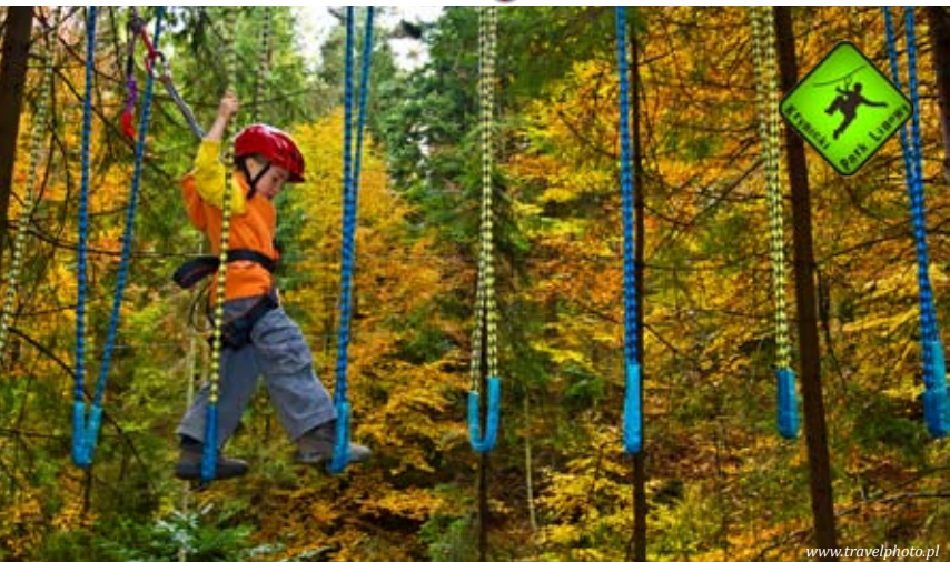
Park linowy w Krynicy-Zdroju