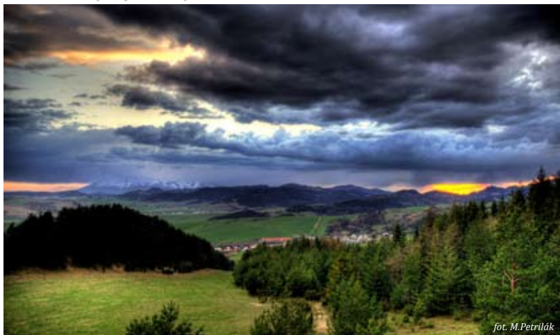
Widok z Prasknutej Skaly na Słowacji