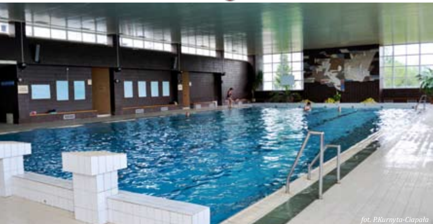
Basen w Starej Lubovni