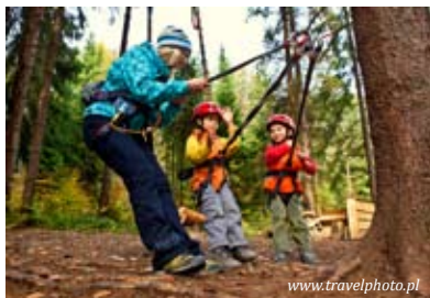
Park linowy w Krynicy-Zdroju

Na terenie parku można skorzystać również z profesjonalnej ścianki wspinaczkowej, trampoliny i mini placu zabaw.