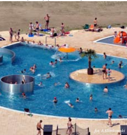
Baseny na Zapopradziu w Muszynie

Centrum Rekreacyjno-Sportowe im. Waldemara Serwińskiego al. Zdrojowa, 33-370 Muszyna tel. +48 18 477 79 60 www.muszyna.pl