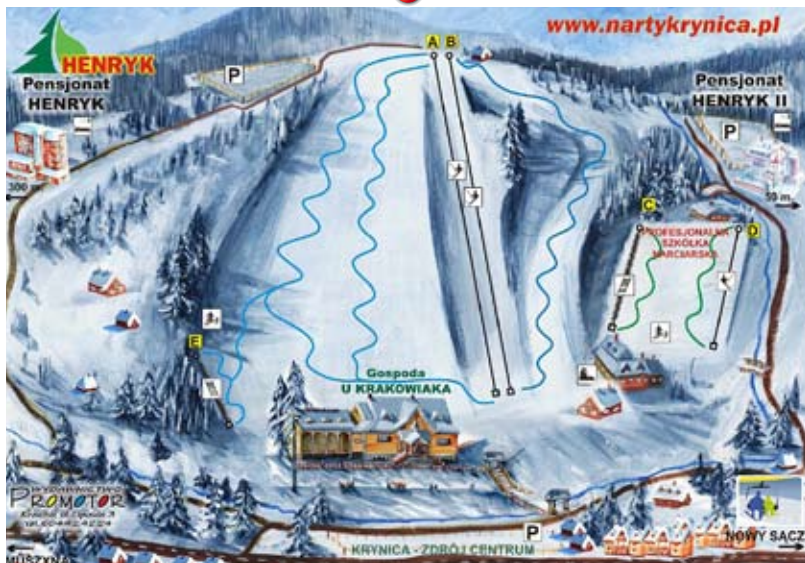
opracowanie i udośćępienie: Gdzie NA NARTY 2013 - www.nanarty.info.pl