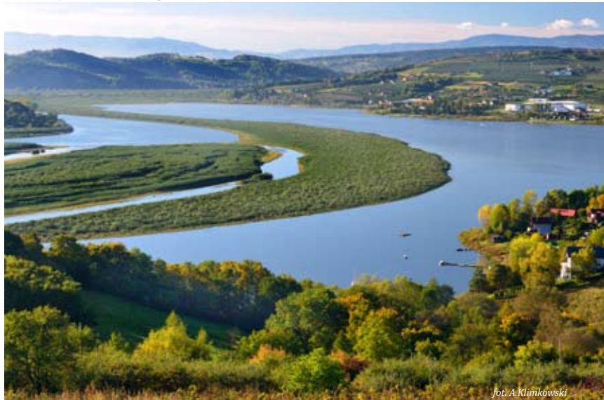
Panorama Jeziora Rożnowskiego

In the area of Stará Ľubovňa routes were prepared for the trips on the Dunajec. Length of the routes: 9-50 km. Time of the trip: from 2h to 3 days.