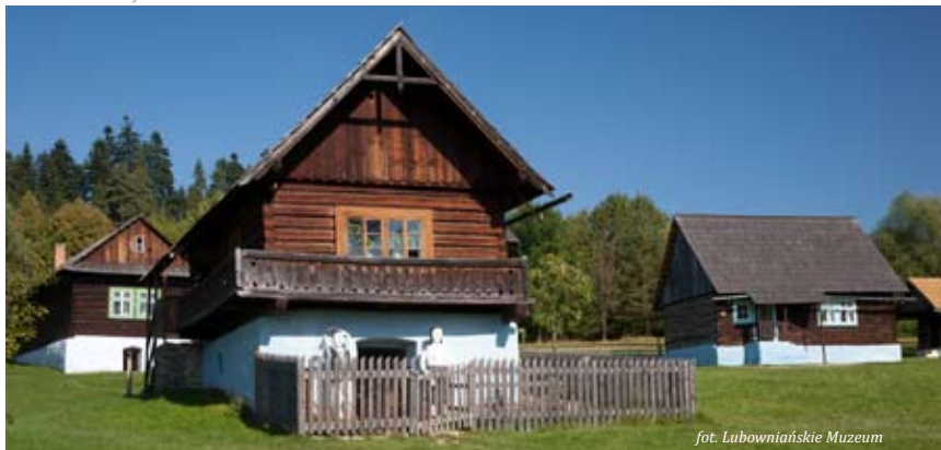
fol. Lubowniańskie Muzeum

maj-wrzesień: poniedziałek-niedziela 9.00-19.00, październik: wtorek-niedziela 10.00-16.00, listopad-marzec: tylko wcześniej zgłoszone grupy powyżej 30 osób, kwiecień: wtorek-niedziela 9.00-16.00