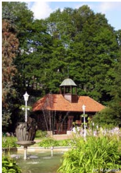
fol. M. Adamk