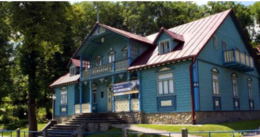
fol. E. Mrózek

godziny zwiedzania: wtorek-niedziela 10.00-13.00 i 14.00-17.00, poniedziałek - nieczynne