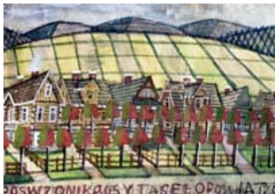
Akwarela autorstwa Nikifora