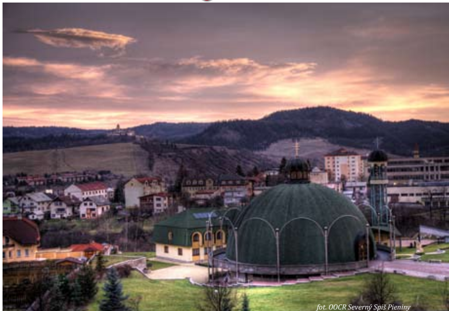
fol. OOCR Severný Spiš Pieniny