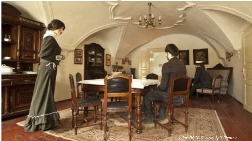
fol. OOCR Severný Spiš Pieniny