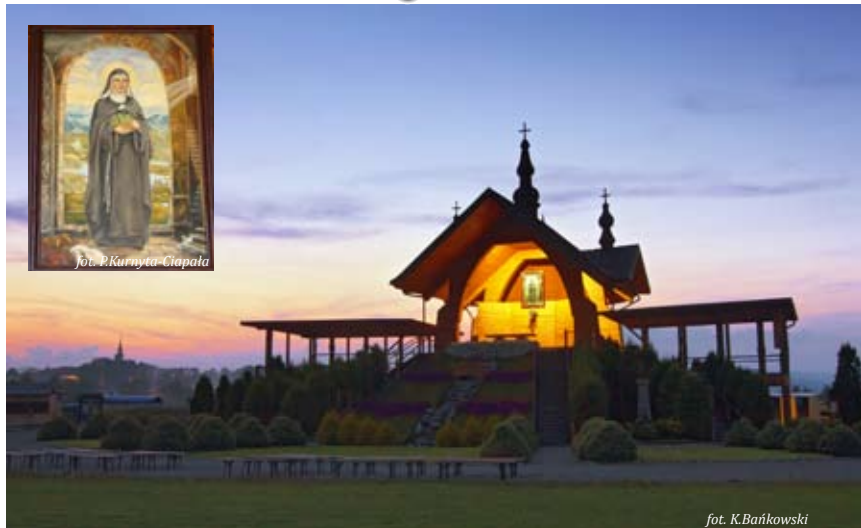
Obraz św. Kingi na Ołtarzu Papieskim i Ołtarz Papieski

Tuż obok Ołtarza powstał Dom Pielgrzyma „Opoka”, który oferuje usługi noclegowe, gastronomiczne, wynajem sal konferencyjno-bankietowych oraz szeroki program posługi duszpasterskiej w ramach rekolekcji, spotkań formacyjnych i turystyki religijnej. Grupy pielgrzymkowe mogą skorzystać z 80-osobowej kaplicy lub uczestniczyć we mszy świętej odprawianej na Ołtarzu Papieskim. W Opoce