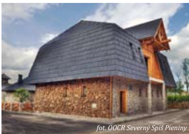
fol. OOCR Severný Spiš Pieniny

Objekty ľudovej architektúry z oblasti horného Spiša a Šariša, cenný gréckokatolícky chrám z Matysovej z roku 1833 s barokovým ikonostasom, rôzne slávnosti v areáli, prezentácie starých ľudových zvykov. Kostol sv. Archaniela Michala v skanzéne v Starej