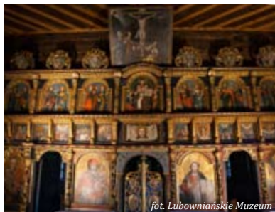
fol. Lubowniańskie Muzeum