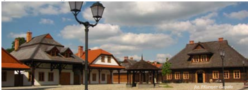
Rynek w Miasteczku Galicyjskim

godziny zwiedzania: wtorek-niedziela 9.00-16.00 poniedziałek - nieczynne