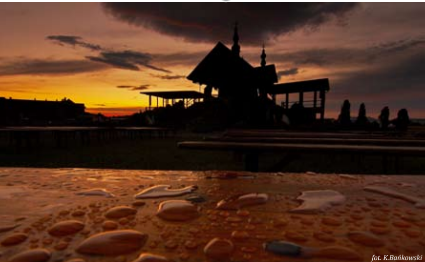
fol. K. Bańkowski