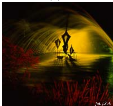
fol. J. Zak