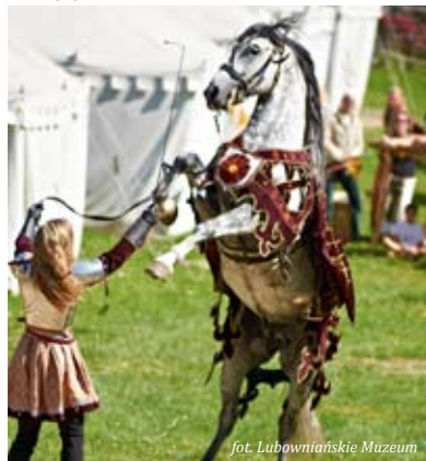
Turniej rycerski w taborze

Historical review of the alcohol production and crafts, the whole process is presented starting with growing crops, through middle stages and finally the finished product - spirit - following the traditional recipe, an opportunity to taste the Slovak whisky.