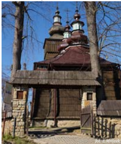
Cerkiew w Andrzejówce

Niecodzienny jest „dzwon Ewy” - podwieszana u stropu metalowa sztaba z nawierconymi otworami. Uderzenie w odpowiednie miejsce powoduje wydobywanie dźwięków o różnej wysokości.