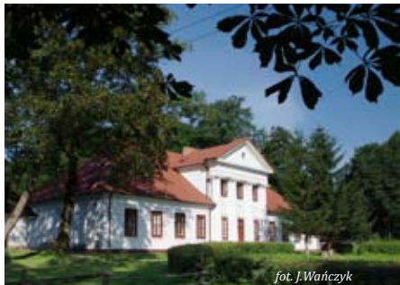
Dwór w Rożnowie

W Rożnowie zachowały się pochodzące z XVI wieku resztki fortyfikacji oraz jedna z niewielu na świecie beluarda datowana na XVII-XVIII w. Na uwagę zasługuje również dwór z XIX w. Nad miejscowością dominują ruiny zamku rodu Rożeńów z XIV w. W XV wieku warownię kupił Zawisza Czarny z Garbowa herbu Sulima, bohater spod Grunwaldu. W okresie późniejszym zamek przeszedł w ręce Leliwitów Tarnowskich. Nie był już wówczas używany i popadł w ruinę.