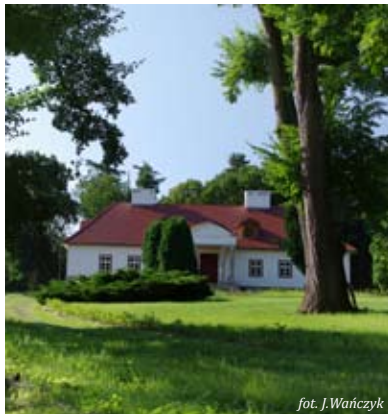
Dwór w Witowicach

Pevnosť z XII storočia, veľakrát prestavaný, bol zruinovaný po požiari v XIX storočí.