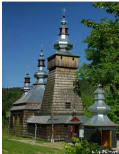
Kościół w Bereścine

Rímskokatolícky kostol z XIX storočia, s tromi hlavnými loďami (pseudobazyliálny) v pseudorománskom slohu, s klasicistickými elementmi, obraz Panny Márie ružencovej z roku 1883, obraz Povýšenia z roku 1869, obrázok Kalvárie barokovo-klasistického štýlu z konca XVIII storočia.