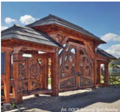
fol. OOCR Severný Spiš Pieniny