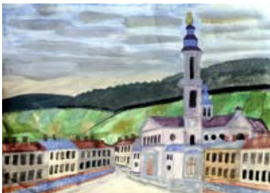
Akwarela autorstwa Nikifora