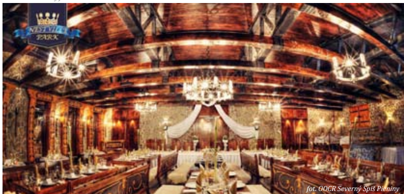
Sala restauracyjna w Nestville Park