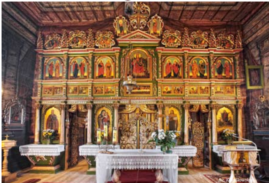
Wnętrze cerkwi w Andrzejówce