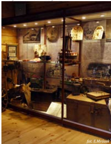
Zbiory muzealne w Muszynie

godziny zwiedzania: poniedziałek-sobota 9.00-17.00, niedziela 13.00-17.00