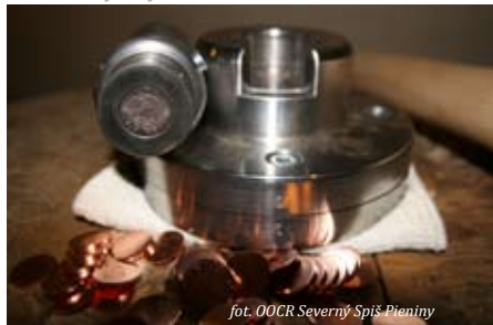
fol. OOCR Severný Spiš Pieniny