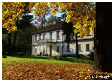
Pałac w Marcinkowicach

located on the hill called Baszta (Tower); the castle built around 1390; situated on the border; severely destroyed in 1470; rebuilt in the Renaissance style; the fragments of the southern walls preserved; fragments of the tower.