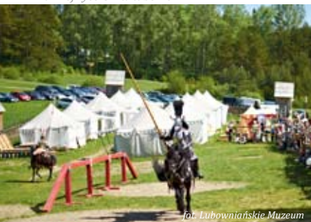
fol. Lubowňańskie Muzeum