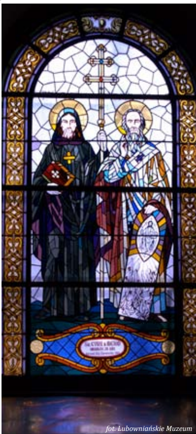
fol. Lubowoniańskie Muzeum

Architektura oraz wyposażenie kościoła są niemal całkowicie barokowe. Wyjątkiem jest tylko najstarsza rzeźba w świątyni – tzw. Madonna lubowniańska, umieszczona na szczycie ołtarza św. Rodziny. To jedyna gotycka rzeźba w kościele. Natomiast z drugiej połowy