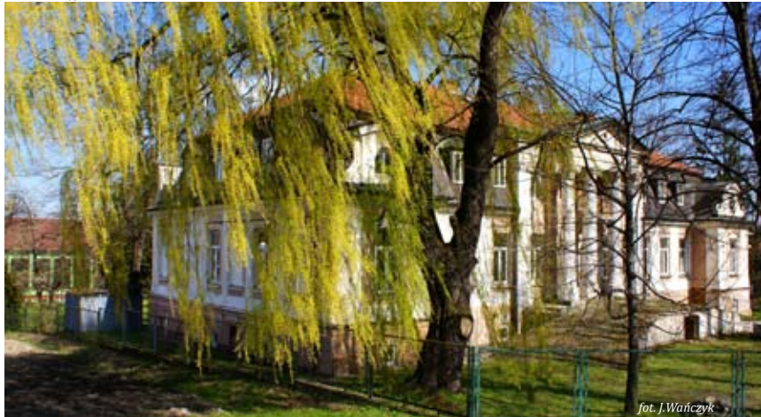
Pałac w Tęgoborzu

W Tęgoborzu znajduje się XIX-wieczny murowany pałac wybudowany przez ród Stadnickich. Pałac jest własnością prywatną i nie został udostępniony do zwiedzania, warto go jednak zobaczyć z zewnątrz. Wspaniale prezentuje się kolumnowy portyk z trójkątnym frontonem oraz piękny taras od strony parku.