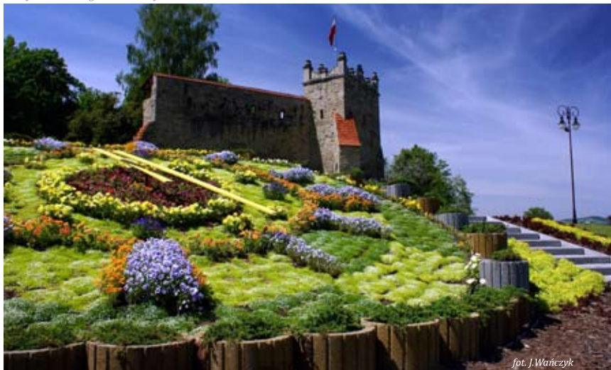
Ruiny zamku i zegar kwiatowy

Tabor” dzięki znajdującemu się w ołtarzu głównym obrazowi Przemienienia Pańskiego z kręgu Veraikon, z XVI w.