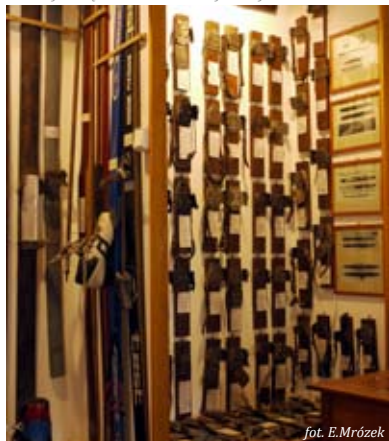
Kolekcja wiązań w Piwnicznej-Zdroju

Kolekcja dawnego sprzętu narciarskiego w Piwnicznej jest największą tego typu w Europie.