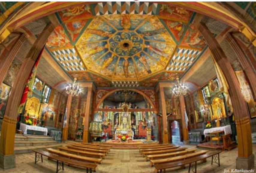
fol. K. Bańkowski