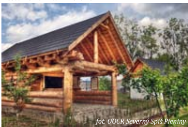
fol. OOCR Severný Spiš Pieniny