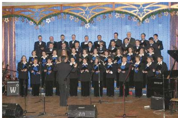
Chór CANTICUM IUBILAEUM podczas występu