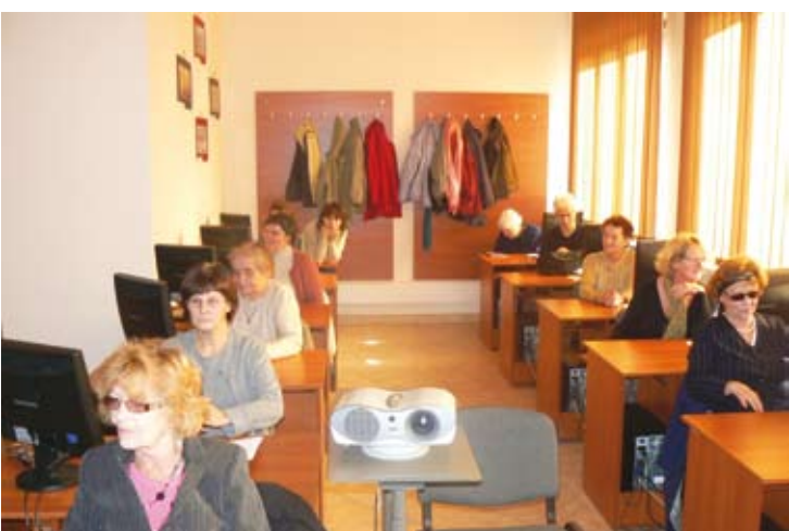
Kurs komputerowy dla organizacji pozarządowych w Nowym Sączu.