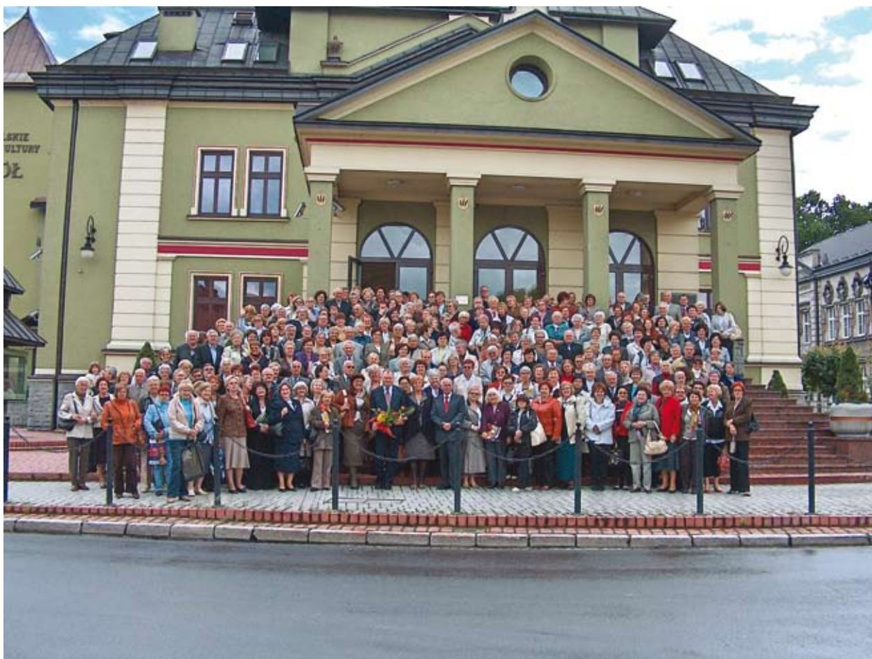
Zakończenie roku akademickiego SUTW (2008/2009)