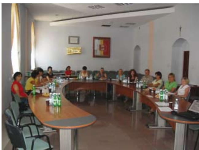
Szkolenie dla organizacji pozarządowych z zakresu zarządzania organizacją i współpracy NGO's z lokalnymi jednostkami samorządu terytorialnego w Nowym Sączu - 14 wrzesień 2009 r.