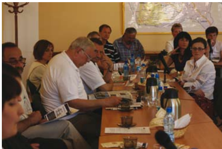
Powiatowe Forum Organizacji Pozarządowych w Limanowej - 21 maj 2009 r.