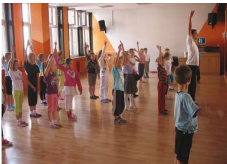
Zajęcia taneczne dla dzieci w ramach projektu „O zdrowie dbam...”