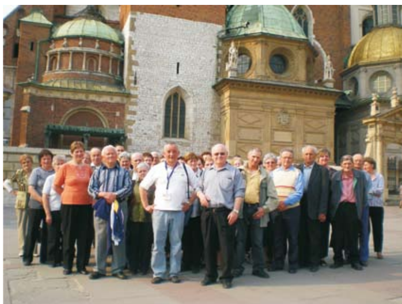
Wyjazd członków stowarzyszenia do Krakowa