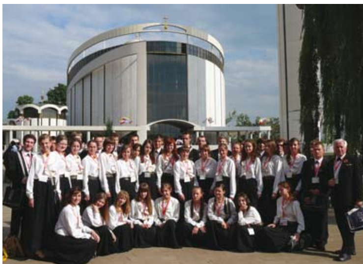
34. Międzynarodowy Kongres „Pueri Cantores” w Krakowie, lipiec 2007

Sukcesy odnoszone przez Chór w sposób wymierny promują Sądeczynę.