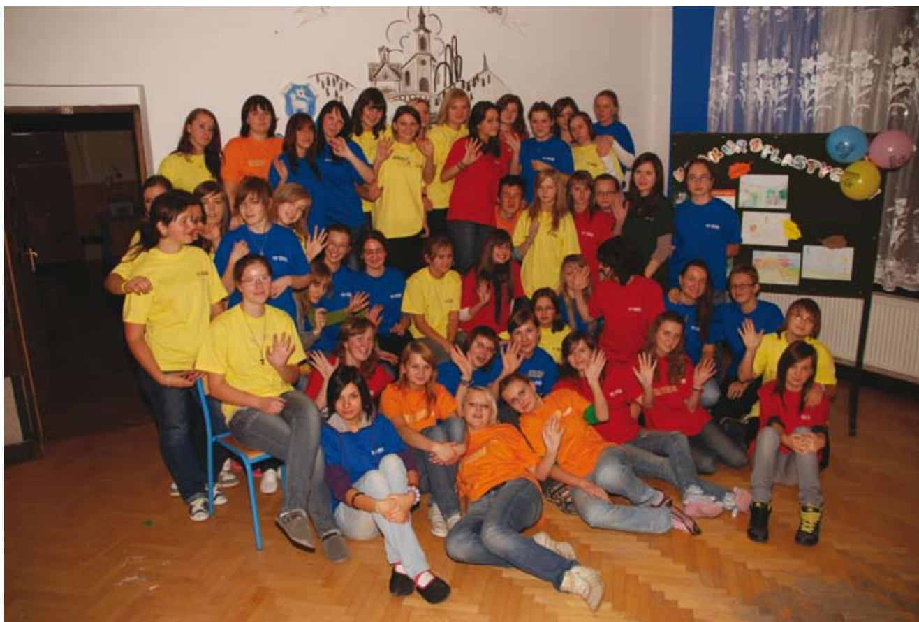
Grupa wolontariuszy Sursum Corda

Mamy satysfakcję, że pomimo wielu trudności działamy coraz szerzej. Jest to możliwe dzięki wielu życzliwym osobom, wspierającym merytorycznie, organizacyjnie i finansowo naszą Organizację Pożytku Publicznego. Jesteśmy otwarci na współpracę, dlatego każda aktywna osoba jest u nas mile widziana. Wspólnie możemy przecież więcej i lepiej działać” [...].