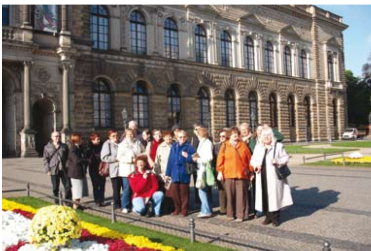
Wyjazd Esperantystów do Drezna - 2009 r.