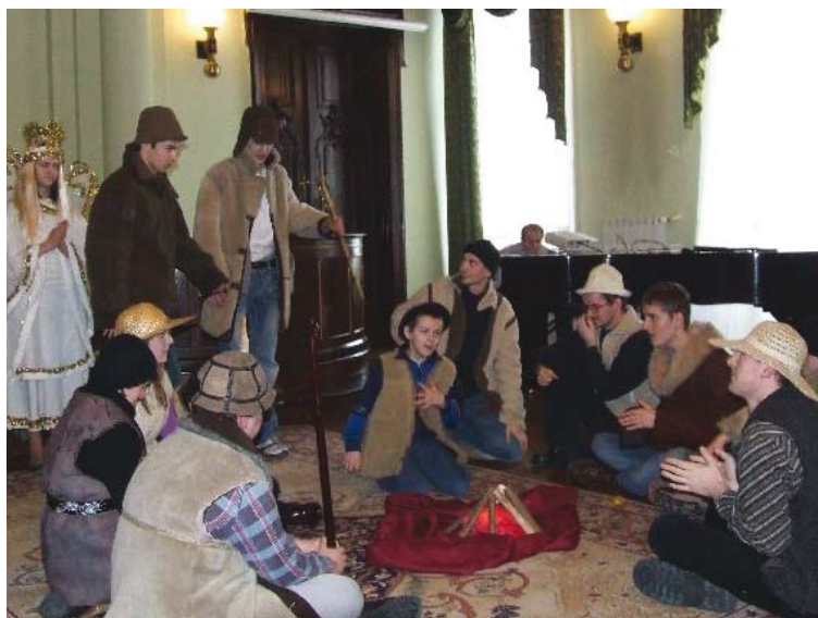
Występ Teatrzyku Muzycznego w Ratuszu w Nowym Sączu